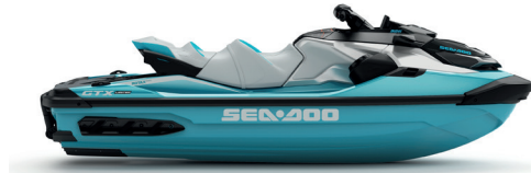
● Teal Metallic