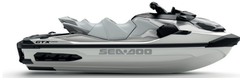
○ White Pearl Premium